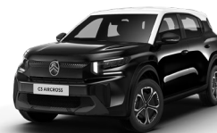
OPAL WHITE z lakierem PERLA NERA BLACK