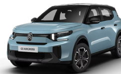
PERLA NERA BLACK z lakierem BLEU MONTE CARLO

● - Standard - - nie występuje P - pakiet opcji