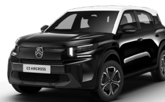
OPAL WHITE z lakierem PERLA NERA BLACK