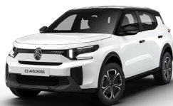
PERLA NERA BLACK z lakierem POLAR WHITE