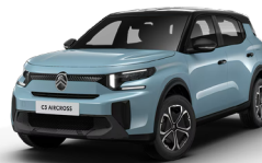
PERLA NERA BLACK z lakierem BLEU MONTE CARLO