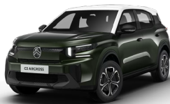
OPAL WHITE z lakierem MONTANA GREEN