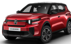
PERLA NERA BLACK z lakierem ELIXIR RED