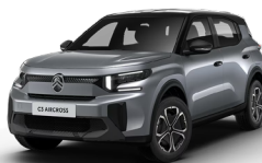
PERLA NERA BLACK z lakierem MERCURY GREY