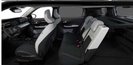
Tapicerka Metropolitan Grey z elementami TEP (Siedzenia Advanced Comfort) (BXFV)